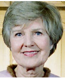
FRIEDE SPRINGER, MEHRHEITSEIGNERIN DER AXEL SPRINGER AG UND STIFTERIN