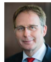
Das Gespräch führte Dr. Christoph Mecking, Institut für Stiftungsberatung